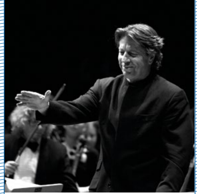
© DR ERNST VAN TIEL Direction