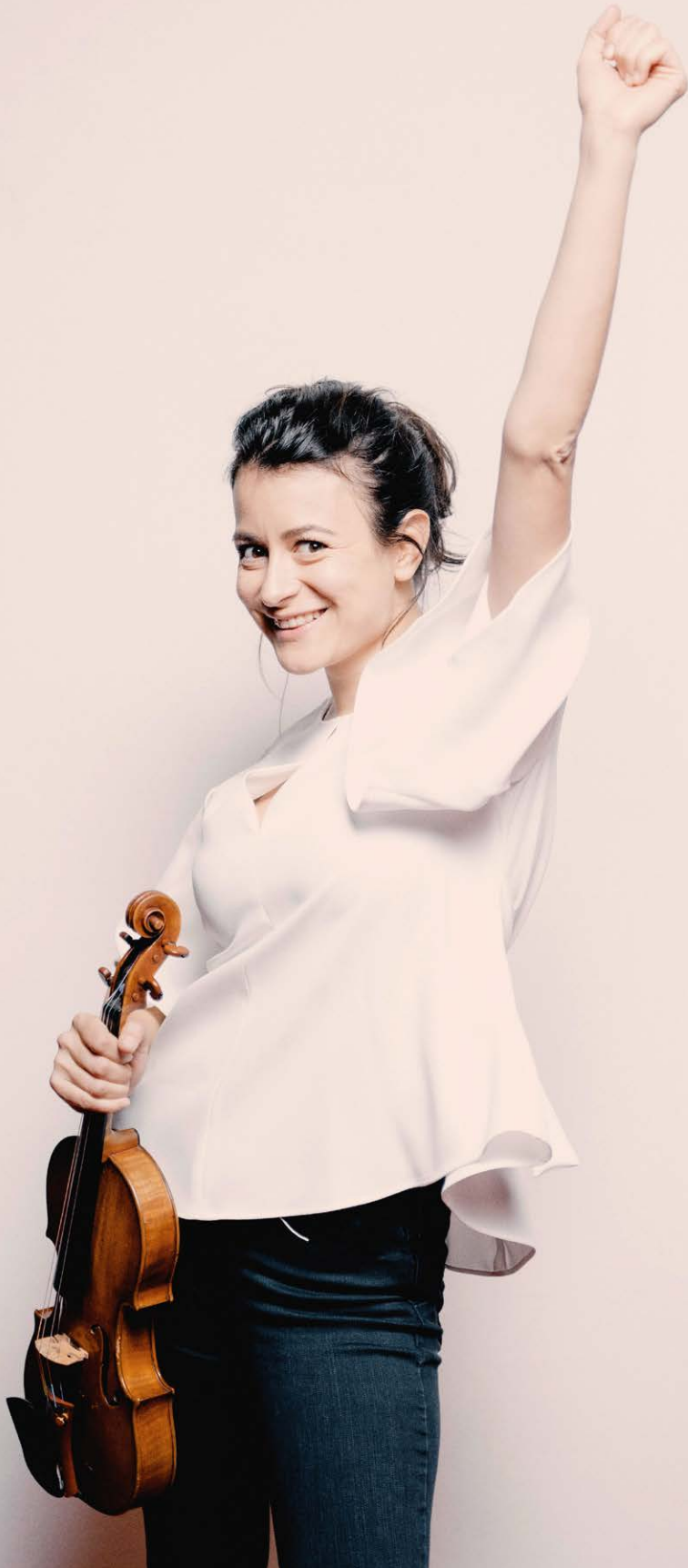
Liya Petrova