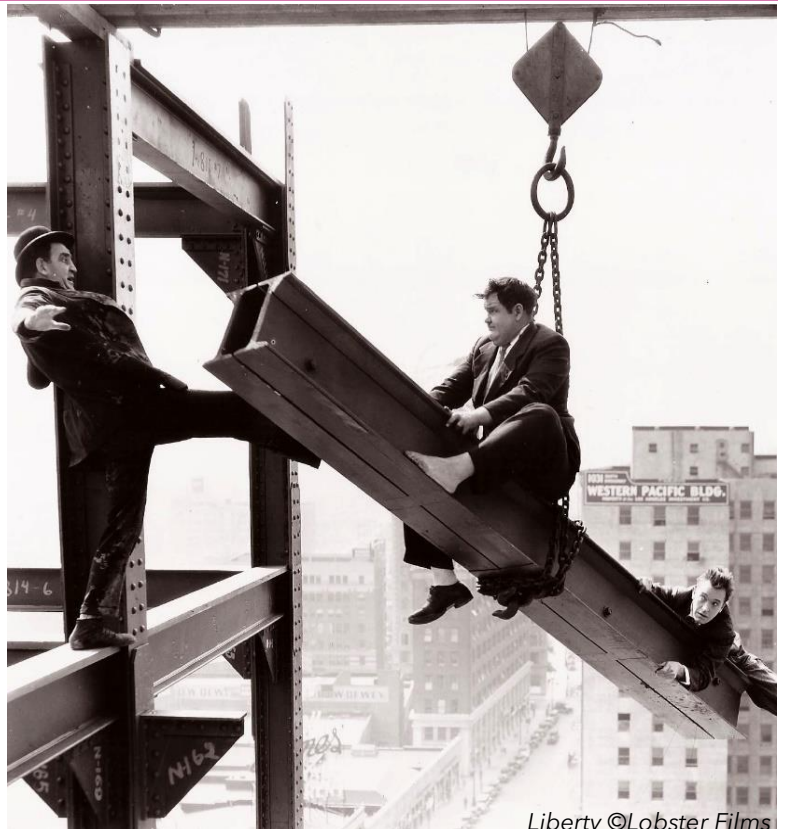
Liberty