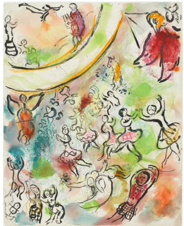
Maquette pour le plafond de l'Opéra Garnier : "Le Lac des cygnes" par Marc Chagall ©Adagp, Paris

Ce concert vous propose de découvrir une version instrumentale (sans danseurs) de ce joyau du ballet romantique composé par Tchaïkovski à la fin du 19 e siècle. Après une présentation des instruments de l'orchestre, vous entendrez une sélection d'extraits emblématiques, à l'instar du poignant thème d'Odette ou de la sautillante danse des petits cygnes, concentré de vivacité et de panache. Laissez-vous envoûter et vibrer à l'unisson avec les musiciens de l'ONPL !