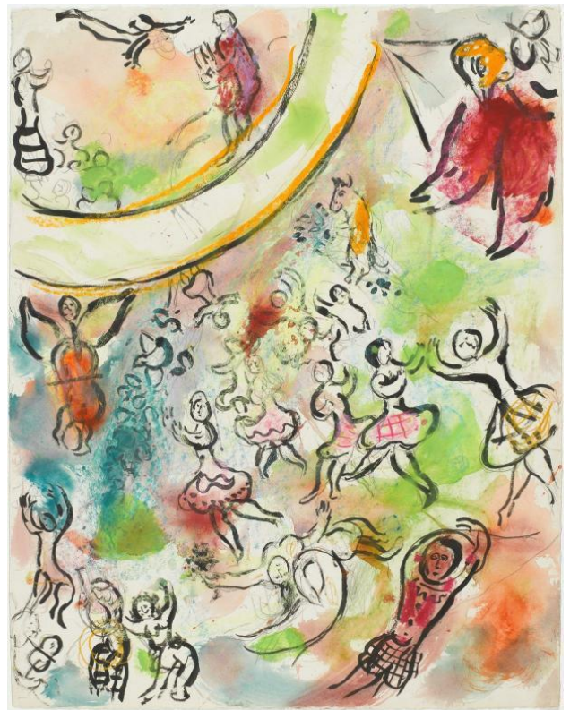
Maquette pour le plafond de l'Opéra Garnier : "Le Lac des cygnes" par Marc Chagall ©Adagp, Paris

Ce concert vous propose de découvrir une version instrumentale (sans danseurs) de ce joyau du ballet romantique composé par Tchaïkovski à la fin du 19 e siècle. Après une présentation des instruments de l'orchestre, vous entendrez une sélection d'extraits emblématiques, à l'instar du poignant thème d'Odette ou de la sautillante danse des petits cygnes, concentré de vivacité et de panache. Laissez-vous envoûter et vibrer à l'unisson avec les musiciens de l'ONPL !